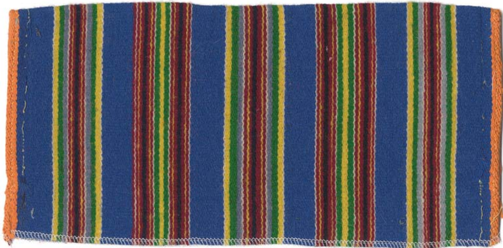
Kadrina seelik. Ripskoes – kantav kahelt poolt.