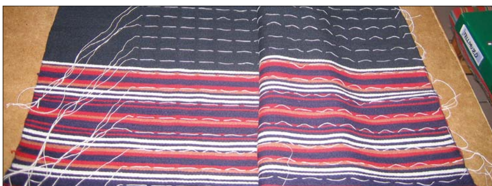
Seelikutegu, alates kurdude kokkutõmbamisest...